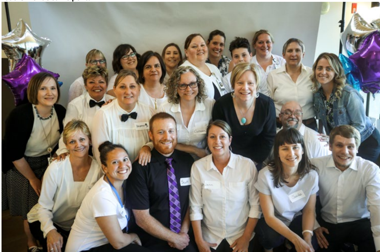
Plus de 20 employés du CRSNB ont donné de leur temps pour accueillir et servir les invités.