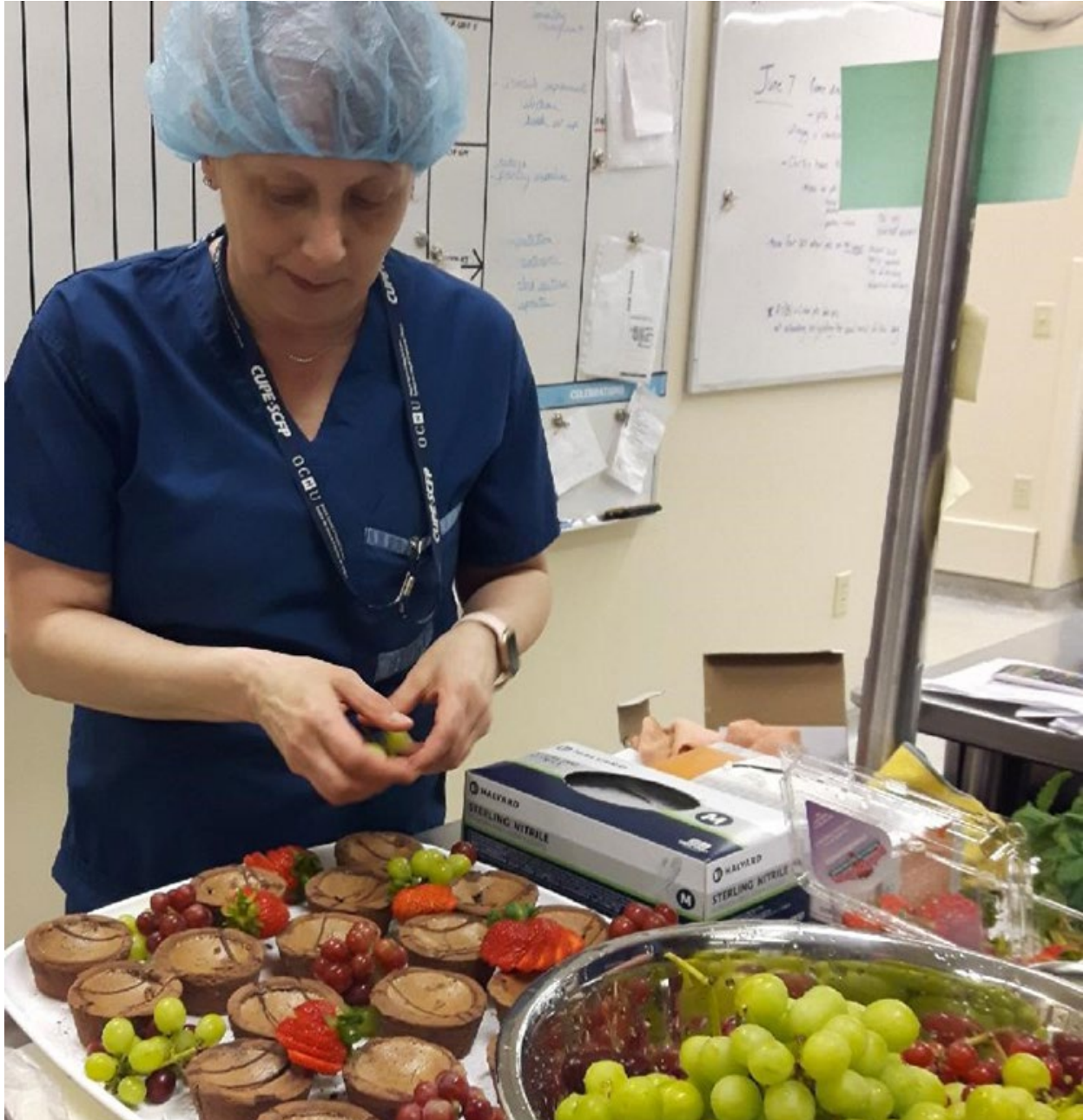
Le personnel des Services d'alimentation des patients a eu du plaisir à laisser aller sa créativité pour préparer un repas formel à trois services.